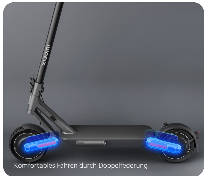
Komfortables Fahren durch Doppelfederung