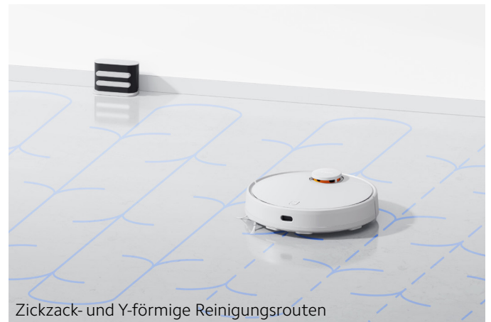
Zickzack- und Y-förmige Reinigungsrouten