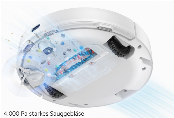
4.000 Pa starkes Sauggebläse